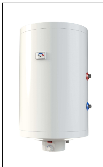
AQ IND...F, AQ IDE...F

A nyilatkozat tárgya / object of the declaration / Gegenstand der Erklärung / Objet de la déclaration / Предмет декларации / Předmět prohlášení / Obiectul declarației: